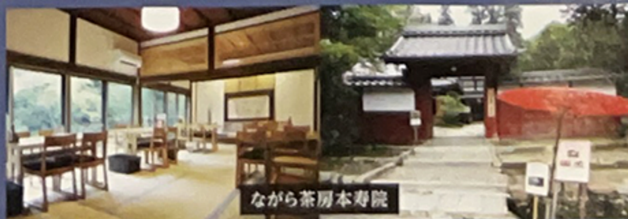
ながら茶房本寿院