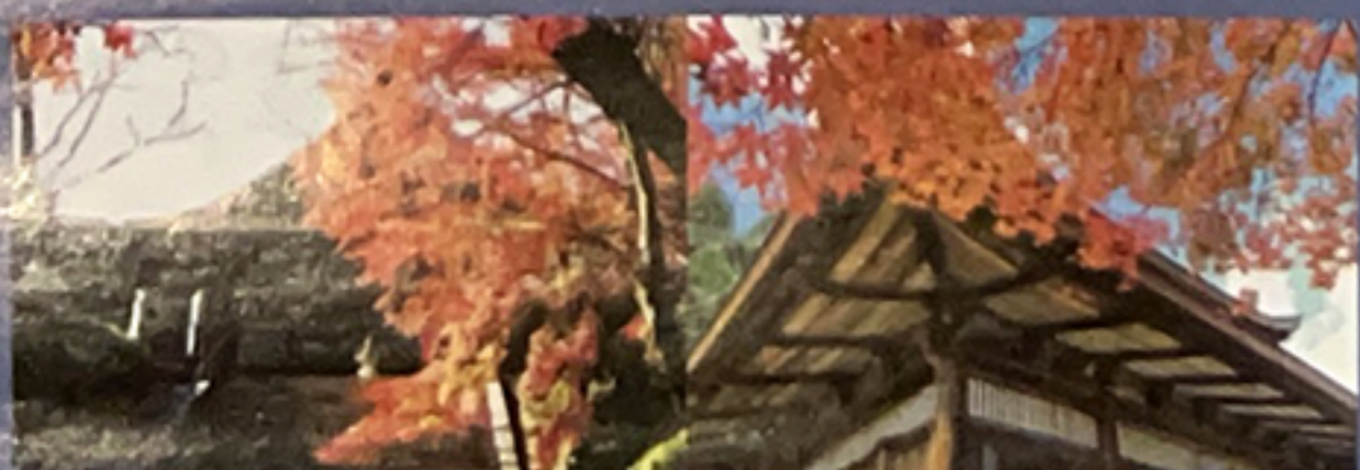
四季折々の景色が移り変わる三井寺。秋は紅葉が色づき美しい景色が楽しめます。