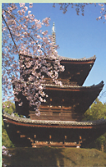
三重塔(重要文化財)